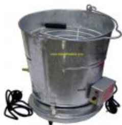
Nr. 74-1200 Rotomaid Eierwaschmaschinen. Leistung 200 Eier.