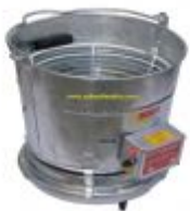
Nr. 74-1100 Rotomaid Eierwaschmaschinen. Leistung 100 Eier.